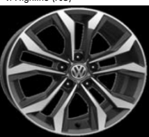
Легкосплавные диски «Soho» 7 J x 17, опционально для Comfortline и Highline (PJ5)