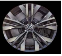
Легкосплавные диски «Ansoa» 8 J x 17, стандартно для Alltrack