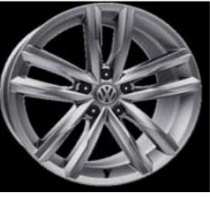
Легкосплавные диски «Dartford» 8 J x 18, серый металл, опционально для Highline (PJ6)