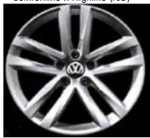
Легкосплавные диски «Salvador» Volkswagen R, 7 J x 17, опционально для Comfortline и Highline (PJD)