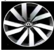
Легкосплавные диски «Marseille» Volkswagen R, 8 J x 18, опционально для Comfortline и Highline (PJE)