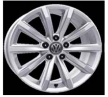
Легкосплавные диски «London» 7 J x 17, стандартно для Highline