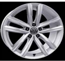
Легкосплавные диски «Dartford» 8 J x 18, серебристые, опционально для Highline (PJ7)