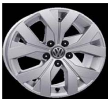
Легкосплавные диски «Moscow» 6.5 J x 16, стандартно для Trendline