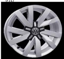
Легкосплавные диски «Aragon» 6.5 J x 16, опционально для Trendline (PJ1)