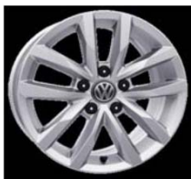
Легкосплавные диски «Serang» 6.5 J x 16, стандартно для Comfortline