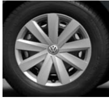
Стальные диски 6.5 J x 16, стандартно для Conceptline