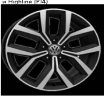
Легкосплавные диски «Nivelles» 7 J x 17, опционально для Comfortline и Highline (PJ4)