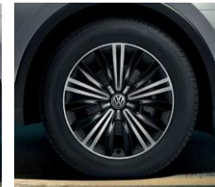
Nizza 7J x 18