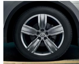
Victoria Falls 7J x 19