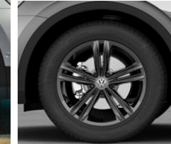
Sebring 7J x 18