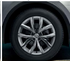
Kingston 7J x 18