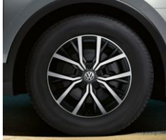
Tulsa 7J x 17