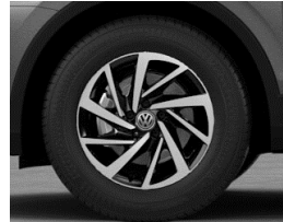
Woodstock 7J x 17