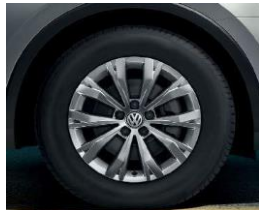
Montana 7J x 17